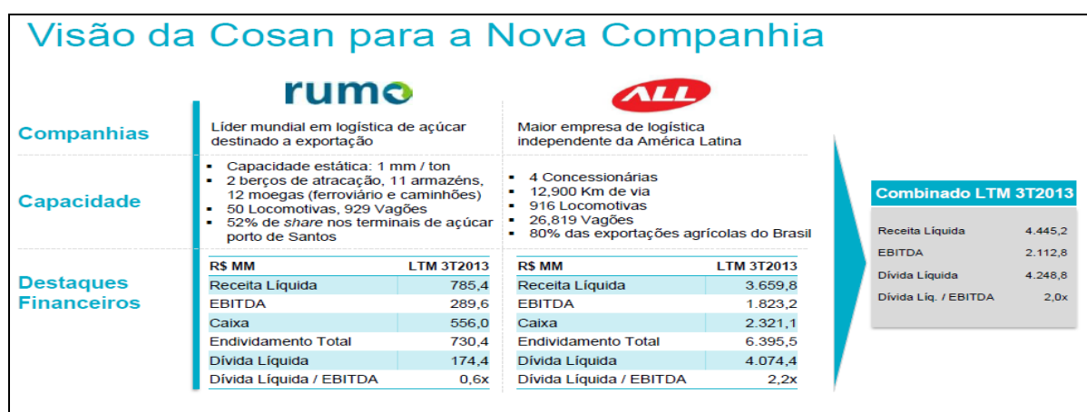
Figura 3: Visão da Cosan para Nova Companhia

A figura 2, por sua vez, demonstra a proposta de constituição da empresa após a fusão, efetivando as intenções presentes na operação e demonstrando a configuração acionária. A figura acima descrita mostra consonância com o que prevê a lei das Sociedades Anônimas nº 6404 de 1976, em seu artigo 228 e define: “A fusão é a operação pela qual se unem duas ou mais sociedades para formar sociedade nova, que lhes sucederá em todos os direitos e obrigações”.