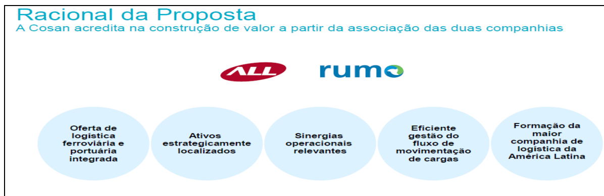
Figura1: Racional da Proposta